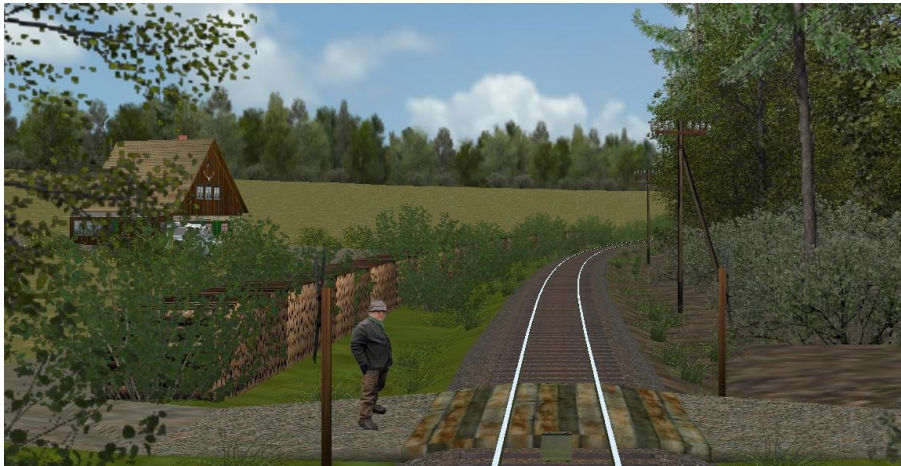
Försterei kurz vor Barntrop